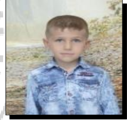
HAZIRLAYAN: YUSUF MELTEM 5/B

BU VATAN ÖLÜMDEN DÖNÜYOR, TEK YÜREK TEK MİLLET OLDUK O GECE, KARANLIĞI YIRTIP AYDINLIĞA ULAŞTIK, DUYURDUK DÜNYAYA SESİMİZİ O GECE.